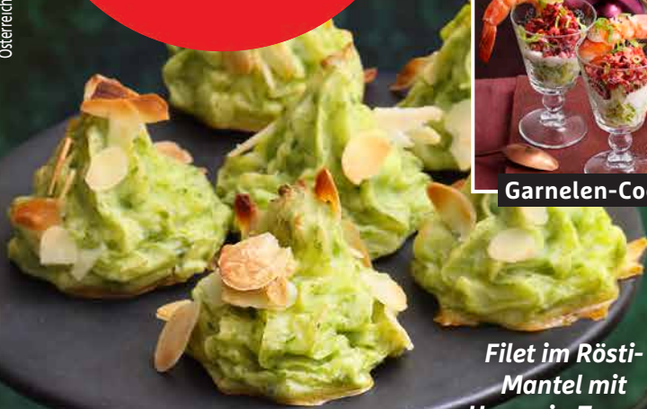
Filet im Rösti- Mantel mit Herzogin-Tannen